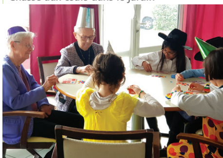
Loto déguisé avec les enfants de l'ALSH