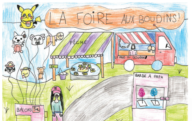
Dessin réalisé pour le concours de la Foire par Adèle, 10 ans