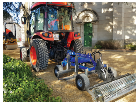
Nouvelle désherbeuse mécanique du CTM