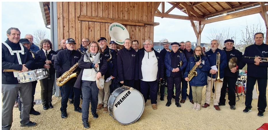
Les musiciens de CNC music venus nombreux

La foire a rassemblé plus de 8 000 visiteurs ce dimanche 9 mars. Un événement marquant pour la commune, plein de découvertes culinaires et d'animations.