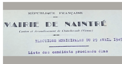
Page de titre du résultat des élections