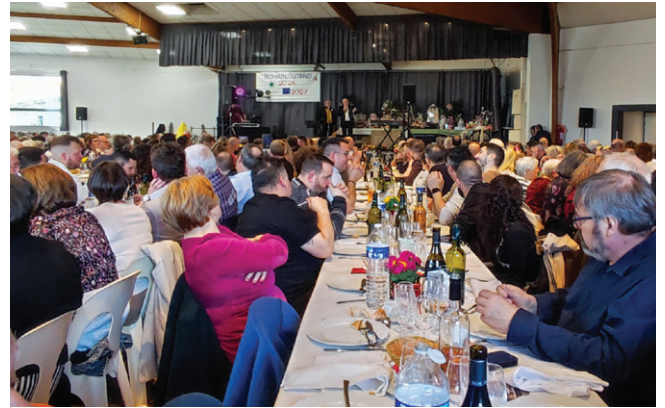
Samedi 1 er mars se déroulait le traditionnel banquet des laboureurs, artisans et commerçants (voir p. 12)