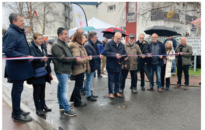
Inauguration de la Foire aux boudins du 9 mars (voir p. 5)