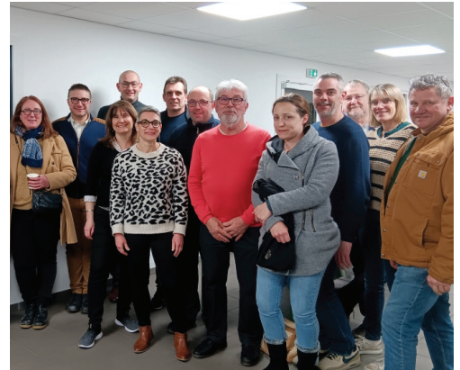
1 er Afterwork chez l'entreprise Brionne Industrie

RÉSEAU ÉCONOMIQUE NAINTRÉEN 1, rue Paul Eluard acteurseconaintré@gmail.com