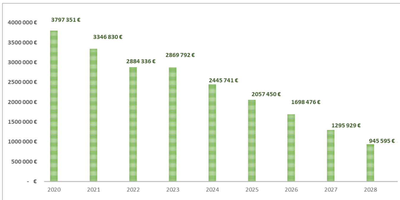
Graphique de l'évolution du capital de la dette à rembourser

Depuis le début du mandat, l'endettement de la commune a été divisé par deux. Cette bonne gestion financière permet à la ville de disposer de marges de manœuvre, sans avoir besoin d'emprunter davantage ni d'augmenter les impôts, pour financer ses projets.