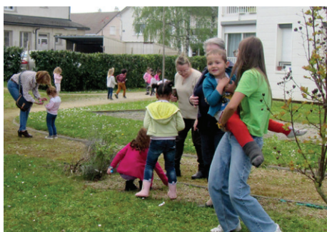
Chasse aux œufs dans le jardin

Que ce soit avec l'école St Joseph ou l'Accueil de loisirs du Riveau, les résident(e)s sont ravi(e)s de partager un moment avec les enfants le temps d'un jeu, d'un goûter, d'un atelier jardinage ou encore d'une chasse aux œufs de Pâques.