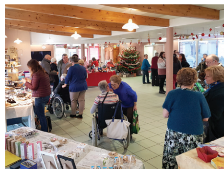
Marché de Noël des Résidences

Le 19 juin, "Les orgues de barbaries" viendront créer une ambiance festive pour la fête de la musique.