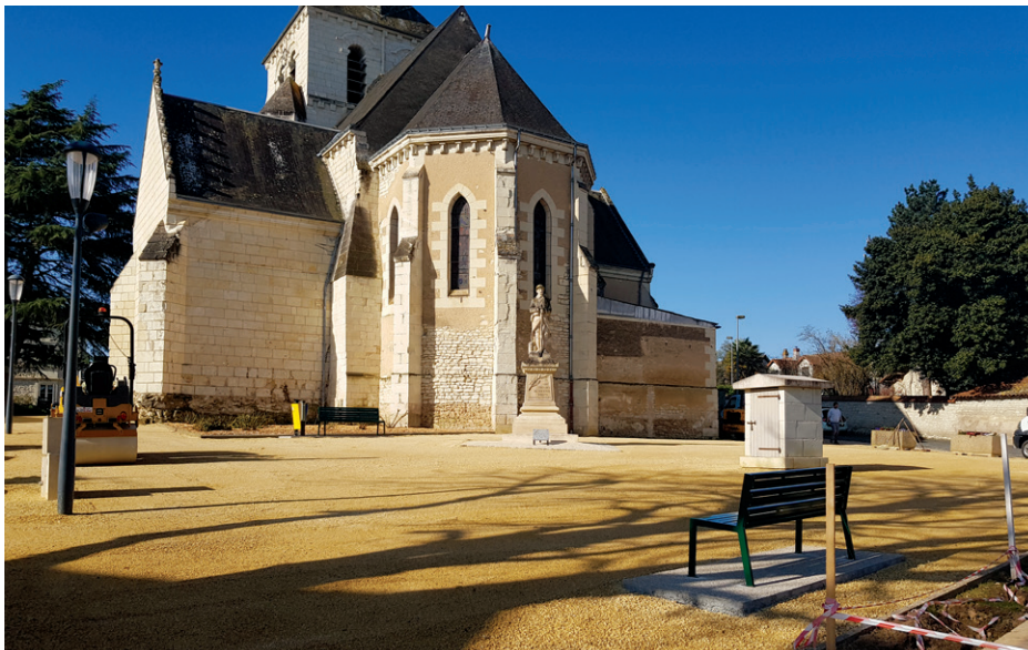
Nouvelle place Gambetta réaménagée

La place de l'église St Vincent, connue sous le nom de Place Gambetta, a été entièrement rénovée cet hiver, favorisant ainsi la détente des usagers.