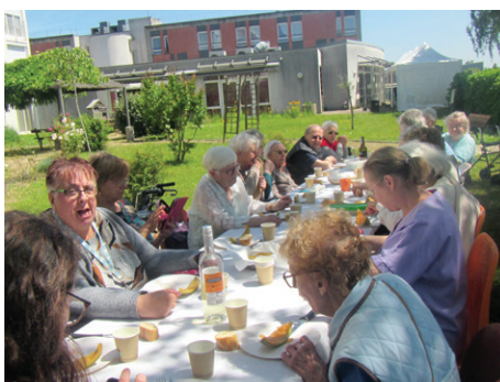
Fête des voisins en extérieur

Ces temps forts apportent convivialité et dynamisme, bouleversant ainsi le rythme habituel et créant des souvenirs inoubliables !