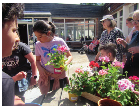
Atelier jardinage avec l'école St Joseph