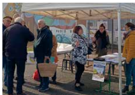
Stand de concertation du 3 mars

Merci pour votre fidélité et parlez-en autour de vous. C'est gratuit et facile d'utilisation !