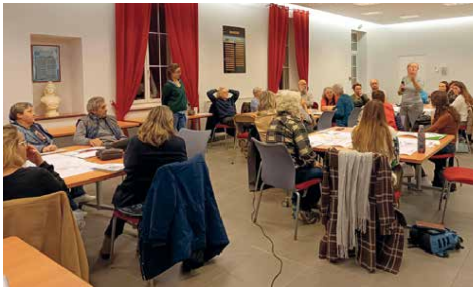
Atelier de concertation du 1 er février 2024

A l'atelier de concertation du 1 er février et au stand du marché du 3 mars, les naintréens se sont exprimés sur les scénarios proposés.