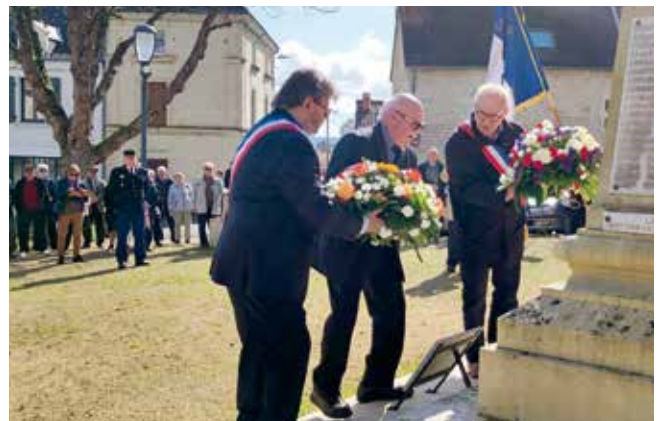
Cérémonie du 19 mars 2024