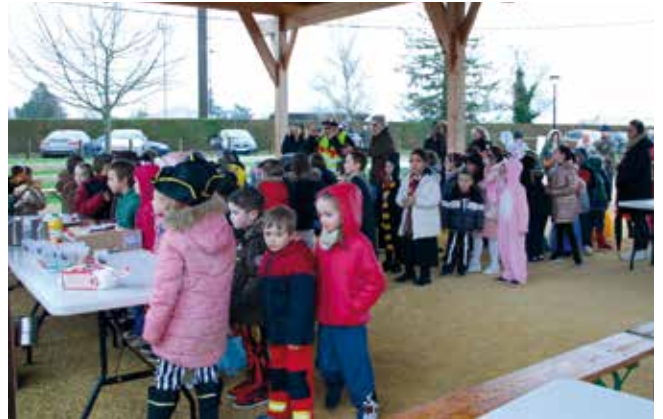
Belle réussite pour le carnaval des écoles du 16 mars 2024