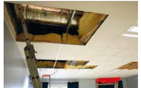
Début de l'installation des conduits du système de chauffage en février