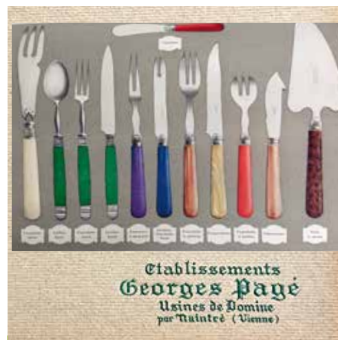
Catalogue « Coutellerie de table et de luxe de Châtellerault » (entre-deux-guerres).