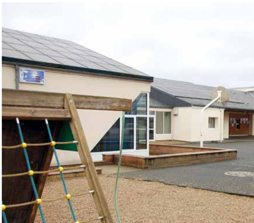
Rénovation de l'école Anne-Frank 2 ème phase en 2024

Il est à noter que la Commune autofinance sans prêt tous ses projets d'investissements, grâce aux efforts de tous et à la bonne gestion du budget communal.