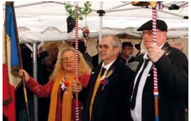
Banquet des laboureurs du 2 mars 2024