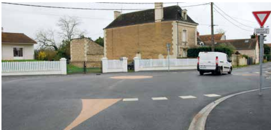
Nouveau rond-point franchissable du Viroux

Le 18 avril sera inauguré l'ensemble des chantiers effectués en présence des financeurs.